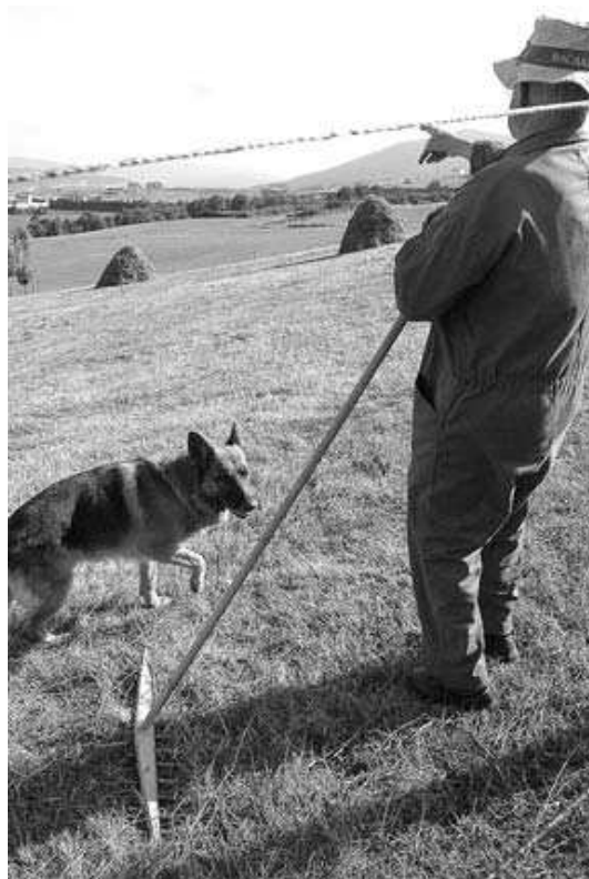
Un veciño sinala unha zona por onde adoitan chegar os raposos

Ante esta situación, os veciños decidiron contactar coa Consellería de Medio Ambiente para informar do que acontecía. A resposta da Administración foi que debían facer unha protesta por escrito. Optaron, entón, por recoller sinaturas para solicitarlle ao Servizo de Observación da Consellería que lles permita organizar unha batida de caza, co fin de reducir o número de animais. “As sinaturas enviámolos o 23 de agosto e aínda non recibimos resposta acerca de posibles solucións”.